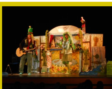
Navštěvujeme divadla.... Divadélko Romaneto