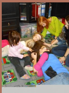
Užíváme si canisterapie....