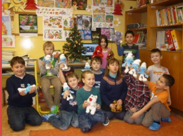
Vánoce slavíme i s Hasiči dětem...