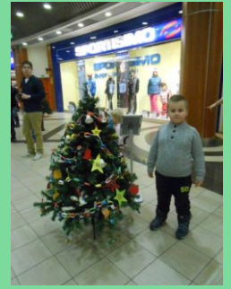
a zdobíme stromeček ve Fénixu...