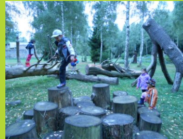
Smišci vyrazili na školičku v přírodě za Krakonošem...