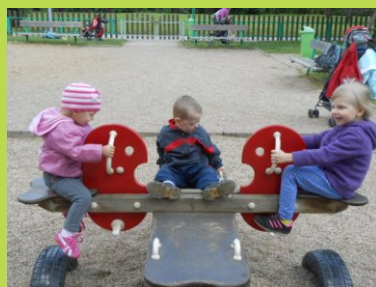
Učíme se, sportujeme, hrajeme si...