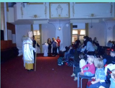
Těšíme se na Mikuláše a čerta se nebojíme...